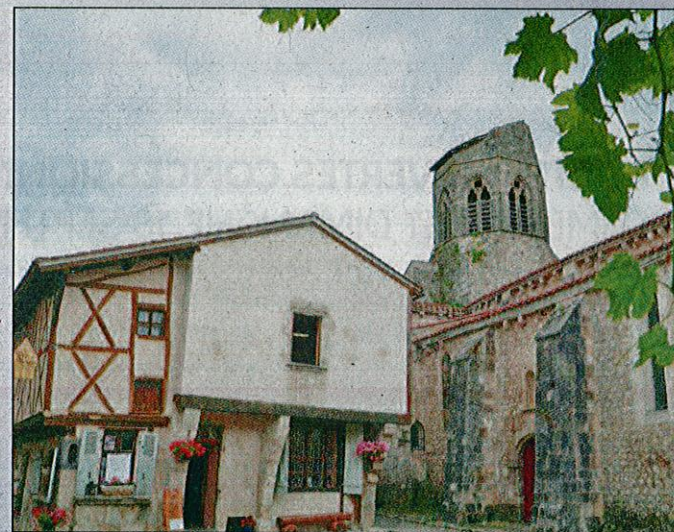
La boutique Bois et Bougies est située au cœur de Charroux.

- Chic'LM : 17, rue Sainte-Cécile, 03200 Vichy. Tél. : 04 70 98 87 09.